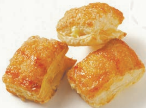
TARTARUGHINE LIMONE B 64.02 22 g ± 3 1,2 Kg