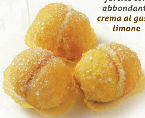
PESCHE LIMONE B 10.03 \bar{\mu} 37 g \pm 3 \boxtimes 1,2 Kg

farcite con abbondante crema al gusto limone