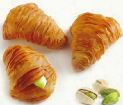
ARAGOSTINE PISTACCHIO B 22.23 \bar{\mu} 32 g \pm 4 \boxtimes 1,5 Kg

Decorate con polvere di cacao e zucchero a velo