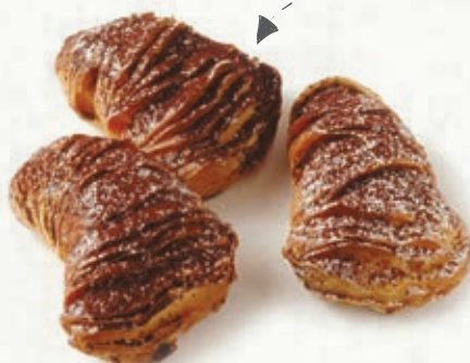
ARAGOSTINE CAPPUCCINO B 22.04 \bar{\mu} 32 g \pm 4 \boxtimes 1,5 Kg

Decorate con polvere di cacao e zucchero a velo