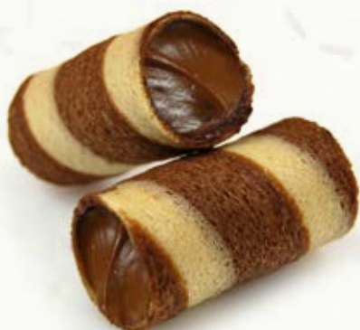
CIOCOWAFER NOCCIOLA CACAO B 22.25 \bar{\mu} 23 g \pm 3 \boxtimes 1,5 Kg