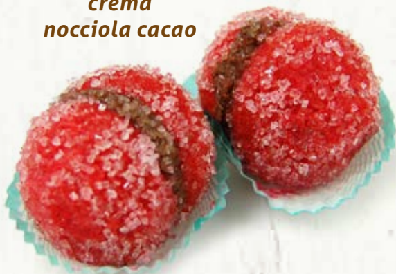
PESCHE NOCCIOLACACAO B 10.01 \bar{\mu} 37 g \pm 3 \boxtimes 1,2 Kg

farcite con abbondante crema al gusto limone