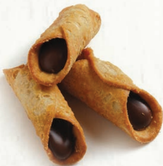
CANNOLI SICILIANI NOCCIOLA CACAO B 27.01 20 g ± 3 1,5 kg