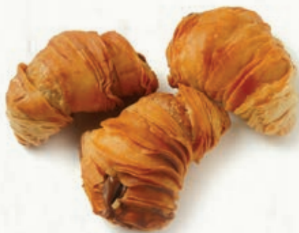
ARAGOSTINE NOCCIOLA CACAO B 22.01 \bar{\mu} 32 g \pm 4 \boxtimes 1,5 Kg