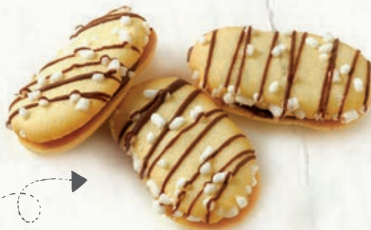
LINGUE ALBICOCCA B 36.06 \bar{\mu} 19 g \pm 3 \boxtimes 1,5 Kg