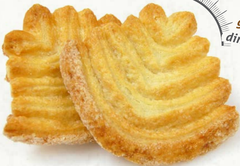
MANINE B 39.03 14 g ± 3 1 Kg x 2