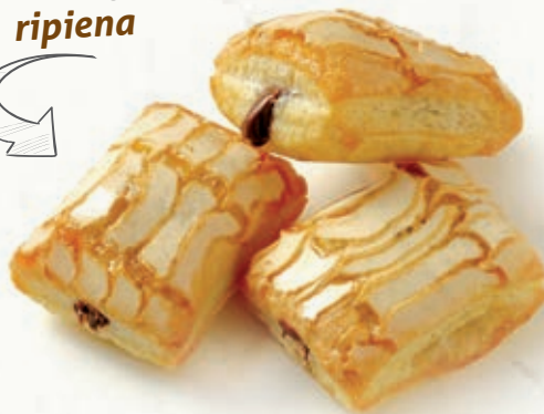
TARTARUGHINE NOCCIOLA CACAO B 64.01 22 g ± 3 1,2 Kg