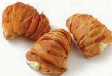
ARAGOSTINE LIMONE B 22.03 \bar{\mu} 32 g \pm 4 \boxtimes 1,5 Kg