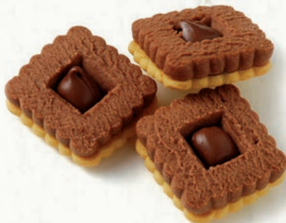
QUADRATINO BICOLORE B 43.10 \bar{\bar{16}} \text{ g} \pm 3 \bar{\bar{1,5}} \text{ Kg}