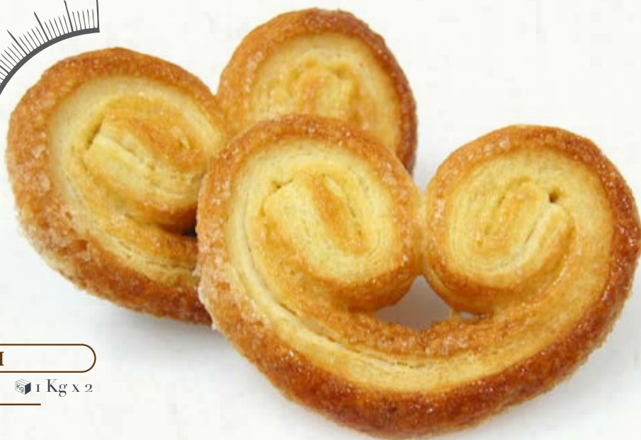
VENTAGLI B 39.02 14 g ± 3 1 Kg x 2