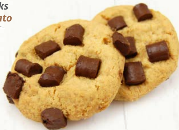
COOKIE CHOCOLATE B 33.12 \bar{\bar{22}} \text{ g} \pm 4 \bar{\bar{1,5}} \text{ Kg}