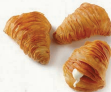
ARAGOSTINE CREMA LATTE B 22.02 \bar{\mu} 32 g \pm 4 \boxtimes 1,5 Kg