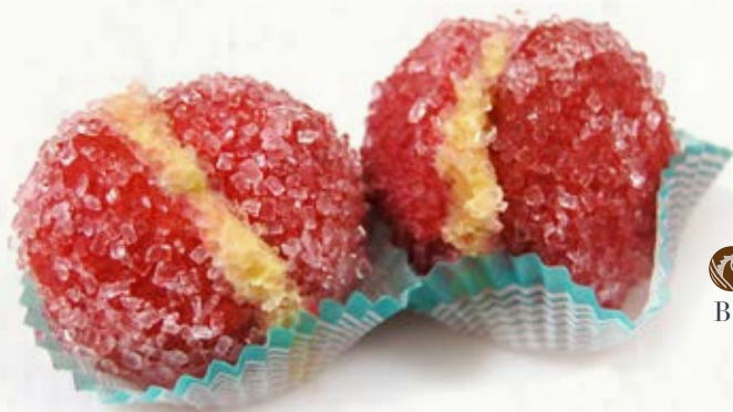
PESCHE CREMA B 10.04 \bar{\mu} 37 g \pm 3 \boxtimes 1,2 Kg