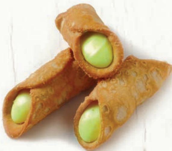
CANNOLI SICILIANI PISTACCHIO B 27.12 20 g ± 3 1,5 kg