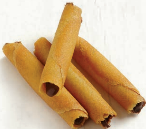
SIGARETTE NOCCIOLA CACAO B 37.02 11 g ± 3 1,5 kg