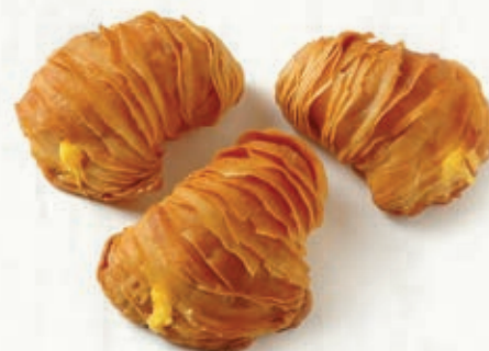
ARAGOSTINE GUSTO ZABAIONE B 22.11 \bar{\mu} 32 g \pm 4 \boxtimes 1,5 Kg