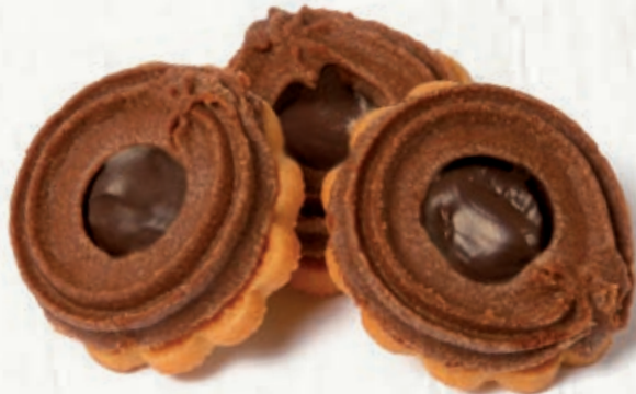
INTRECCIO NOCCIOLA CACAO B 73.02 \bar{\bar{18}} \text{ g} \pm 3 \bar{\bar{1,5}} \text{ Kg}